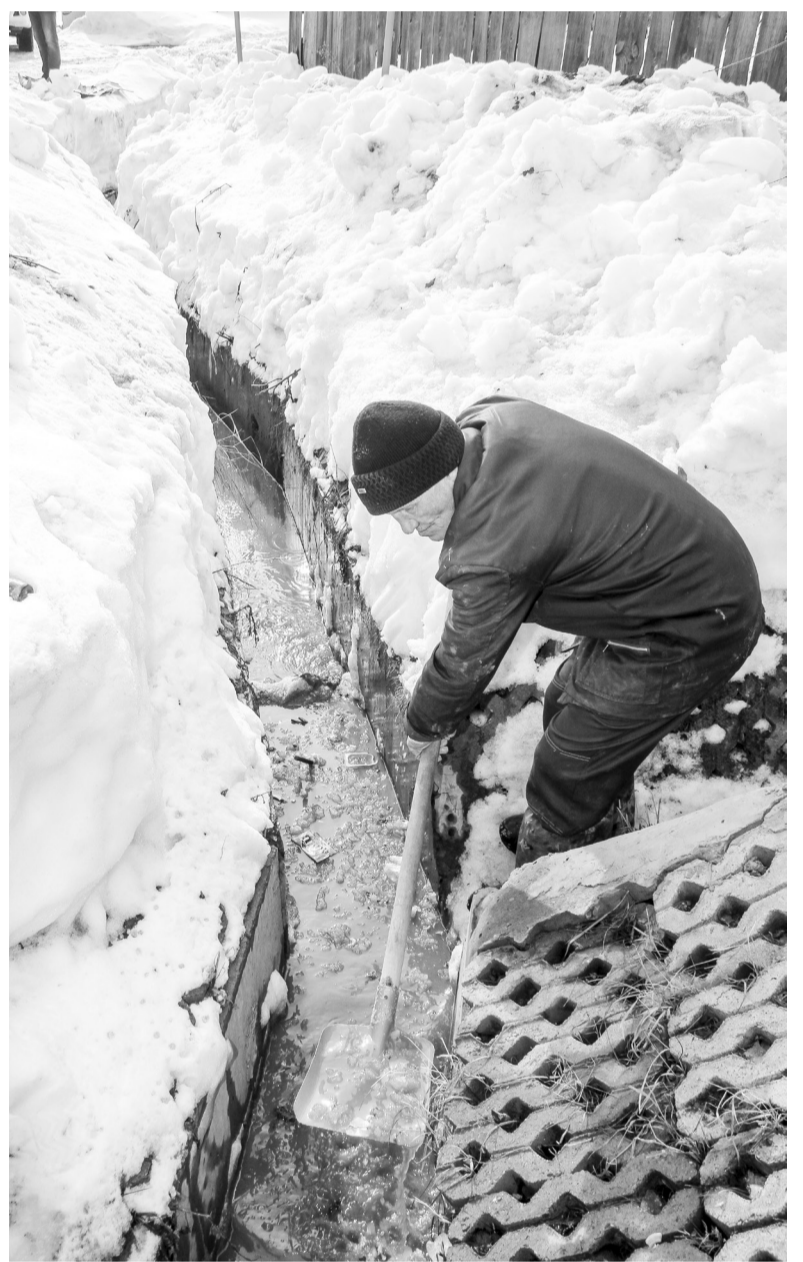
На минувшей неделе противопаводковые работы велись на улицах Ленина, Пономарёва, Сурикова, Раича, Чкалова, Малая и М. Садовая.

Готовятся к встрече паводка и ишимские энергетики. Сотруд-