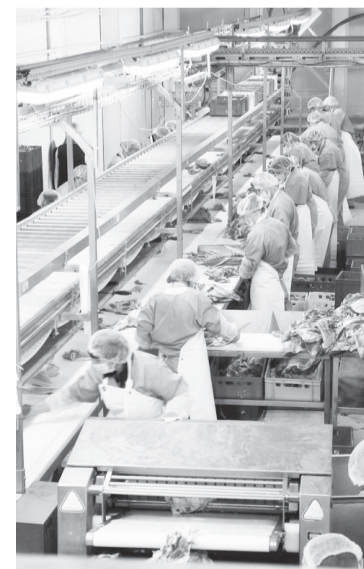
динга «Юбилейный» предстоит отстаивать честь предприятия на областном конкурсе профессионального мастерства.

А они не за горами: 28 ноября лучшему обвальщику Агрохол-