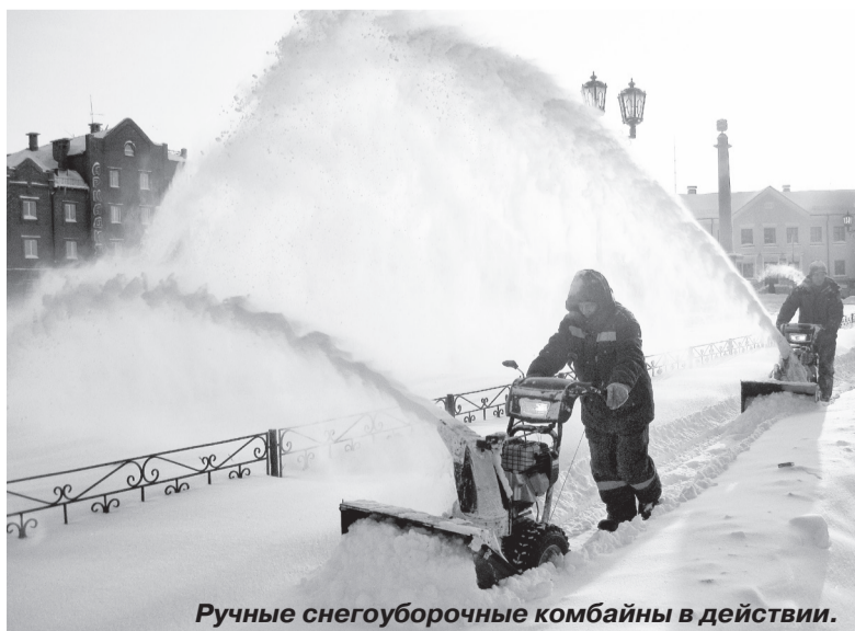
Ручные снегоуборочные комбайны в действии.