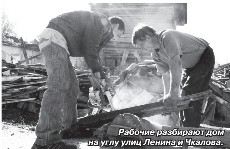
Рабочие разбирают дом на углу улиц Ленина и Чкалова.

В некоторых случаях местным властям приходится занимать принципиальную позицию и добиваться выселения через суд. В любом случае, дом, признанный аварийным и непригодным для проживания, будет снесён. Ни эстетического вида, ни безопасности такие объекты Ишиму не добавляют. К тому же в городе дефицит земли, и высвобожда-