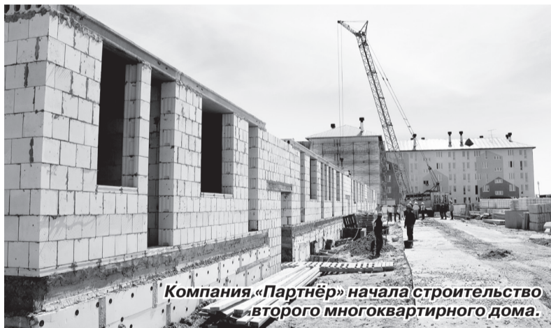
Компания «Партнёр» начала строительство второго многоквартирного дома.