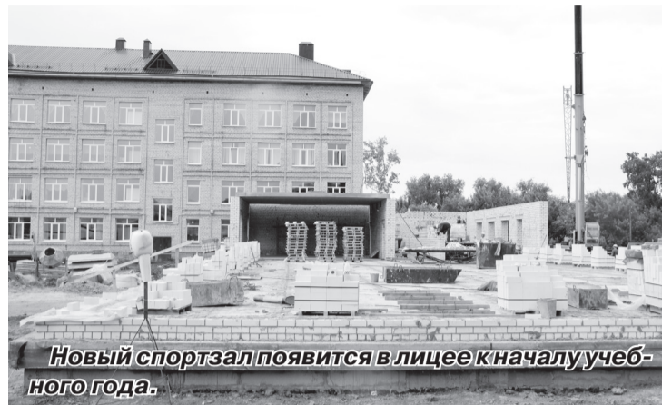
Новый спортзал появится в лицее к началу учебного года.

Вопросы поддержки предпринимательских инициатив губернатор обсудил вместе с участниками Совета по развитию малого и среднего предпринимательства города Ишима. У региона для этого предусмотрен ряд инструментов: как интеллектуальных, так и финансовых. Сопровождение крупнейших проектов берёт на себя областное правительство через департамент инвестиционной политики и государственной поддержки предпринимательства, менее затратные (до 300 миллионов рублей) курирует уполномоченная на это правительством организация – Инвестиционное агентство. Для оперативного решения «бумажных» процедур по оформлению необходимых разрешений и документов разработан проект соглашения между областным правительством, муниципалитетами и федеральными структурами, к которому прилагается перечень инвестиционных проектов. При необходимости внесения изменений в законодательство с инициативой можно обратиться в Тюменскую областную Думу – или, через депутата по своему избирательному округу, на федеральный уровень, если законодательная норма находится в компетенции федерации.