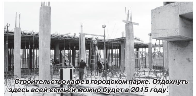
Строительство кафе в городском парке. Отдохнуть здесь всей семьёй можно будет в 2015 году.

– Сегодня перед нами стоит задача – перевести инвестиционную политику региона в иное русло, активизировать муниципальные власти на привлечение инвестиций, а предпринимателей – на расширение дела. Мы должны создать такие условия, чтобы бизнесу было выгодно и комфортно вкладывать средства в развитие той территории, на которой он сегодня живёт и работает. Только совместными усилиями мы сможем изменить жизнь к лучшему и вывести как город Ишим, так и область в целом на новый уровень, – подвёл итог встречи Владимир Якушев.