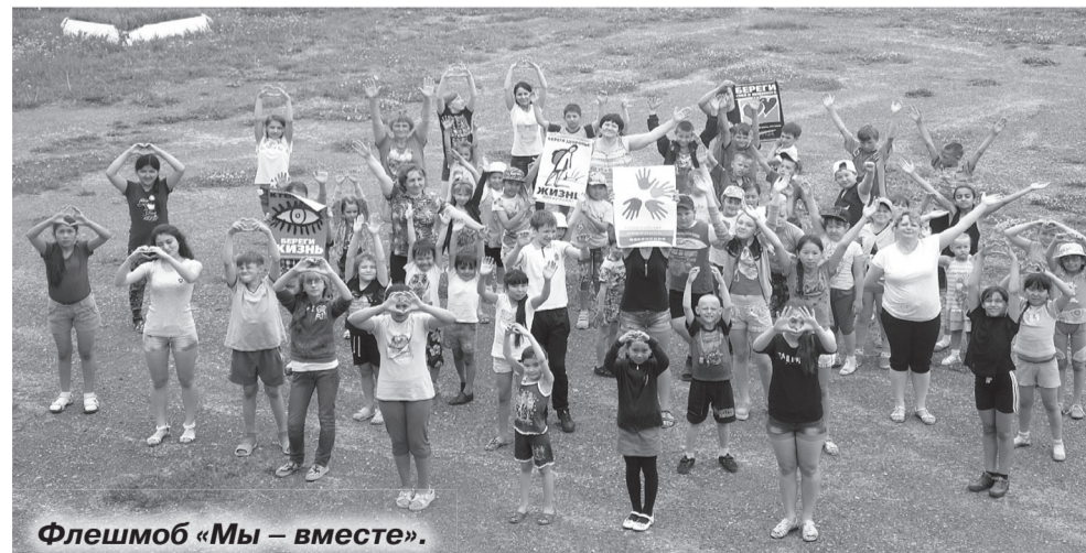
Флешмоб «Мы – вместе».

В этом году у нас был интересный опыт знакомства с казахской культурой. В августе проходило заседание клуба «Семья» по теме «Межэтнические отношения», на