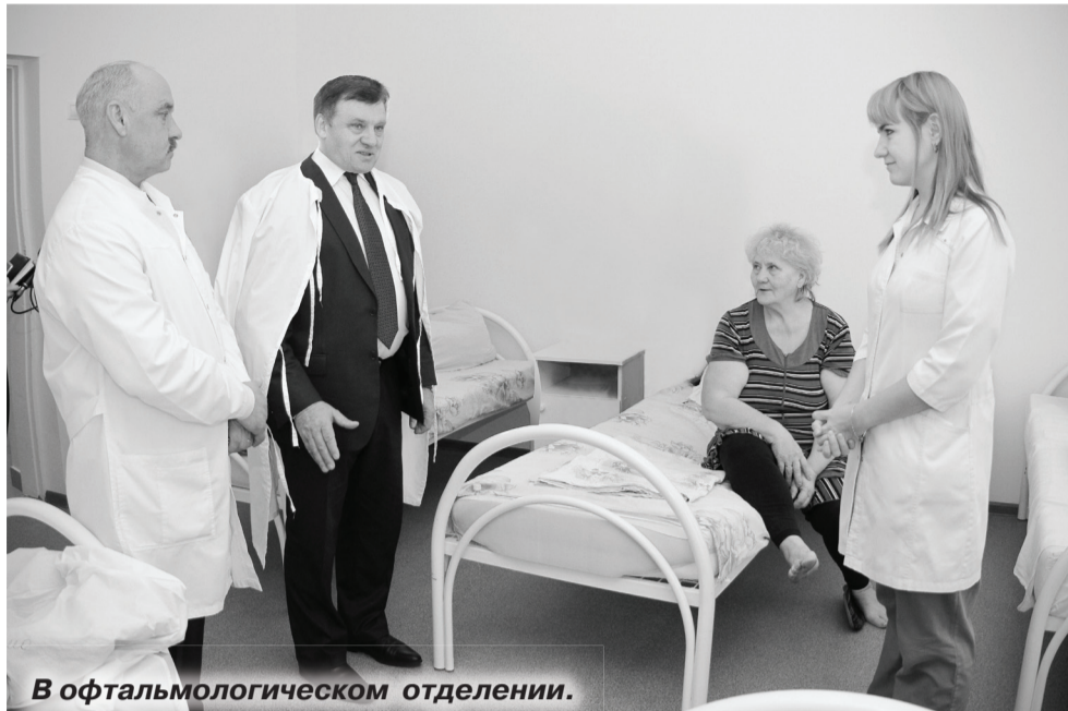
В офтальмологическом отделении.

Капитальным ремонтом поликлиники занимается ишимская компания ООО «Стройимпульс». Полностью завершены работы на первом и третьем этажах, где уже