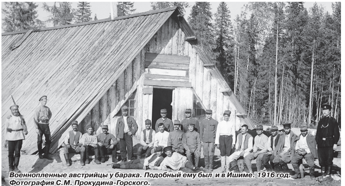
Военнопленные австрийцы у барака. Подобный ему был и в Ишиме. 1916 год.

Своё желание выехать на родину военнопленные излагали в заявлениях, с которыми обращались в административный отдел (орфография источника сохранена): «Я, Егор Рошу... попал в плен во время Империалистической войны... желаю уехать на родину Румыния... прошу не отказать в просьбе»; «Прошу выдать мне справку, подтверждающую