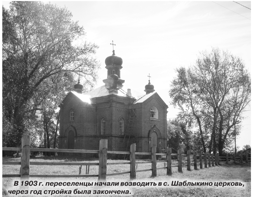
В 1903 г. переселенцы начали возводить в с. Шаблыкино церковь, через год стройка была закончена.

Большую помощь в работе с населением оказывает со-