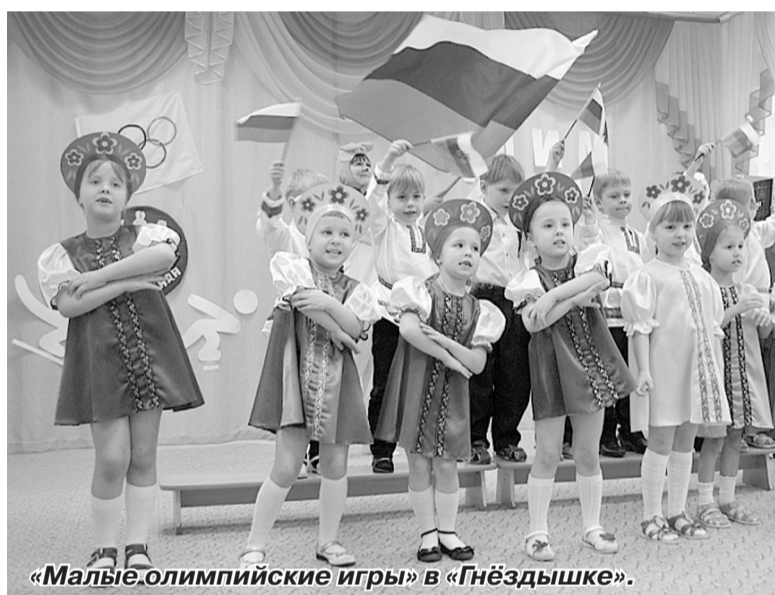
«Малые олимпийские игры» в «Гнёздышке».

7 февраля в Сочи стартовали XXII Олимпийские зимние игры, и это первая зимняя Олимпиада в нашей стране. Столица Олимпиады-2014 была названа 4 июля 2007 года во время очередной сессии Международного олимпийского комитета в Гватемале. Это игры, которые мы выбирали, к которым долго готовились, которые мы заслужили. Игры, которые смотрит и обсуждает весь мир. Игры, к которым причастен каждый.