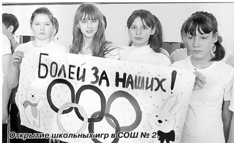
Открытие школьных игр в СОШ № 2.

Акцию, посвящённую 70-летию образования Тюменской области и началу XXII зимних Олимпийских игр в Сочи, провели и в Ишимском районе. 8 февраля на лыжной базе МАУ «Центр физкультурно-оздоровительной работы Ишимского района» в Плешково стартовали соревнования по лыжным гонкам среди команд сельских поселений, команд общеобразовательных учреждений Ишимского района. Состоялись VIP-забег среди руководителей организаций района в рамках первенства Ишимского района по