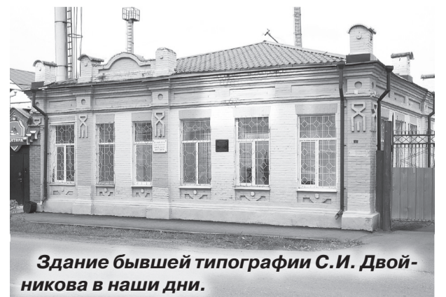
Здание бывшей типографии С.И. Двойникова в наши дни.