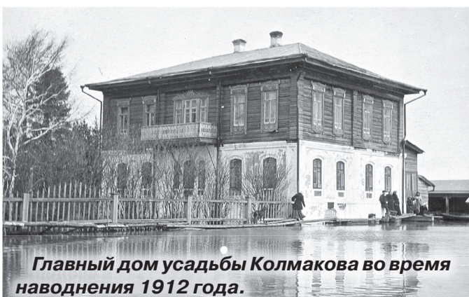
Главный дом усадьбы Колмакова во время наводнения 1912 года.