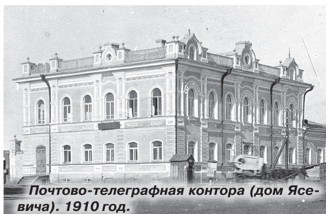
Почтово-телеграфная контора (дом Ясевича). 1910 год.